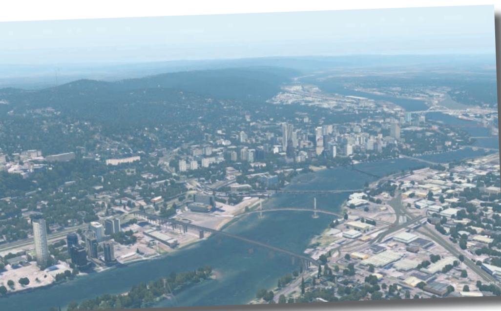
Die Innenstadt von Portland in Oregon mit dem Willamette River im Dunst.

Installiert habe ich zudem den im Osten Washingtons gelegenen KPUW Pullman-Moscow von Aerosoft www.aerosoft.com (er funktioniert trotz der beworbenen Kompatibilität „nur“ für den X-Plane 10“ auch im X-Plane 11 einwandfrei) sowie die Seattle Airports XP von Drzewiecki Design (DD) www.drzewiecki-design.net (Review der P3D-Versionen in den FS MAGAZINen 2 und 4/2018). Diese Produkte sind sinnvolle Ergänzungen